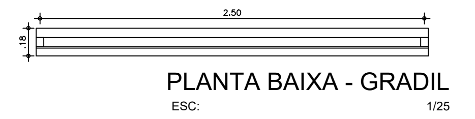
PLANTA BAIXA - GRADIL ESC: 1/25

NOTAS - CONFERIR MEDIDAS, ABERTURAS, NÍVEIS E PRUMOS NO LOCAL; - MEDIDAS EM COTAS PREVALECEM SOBRE O DESENHO; - ESSE DESENHO DEVE SER IMPRESSO COLORIDO.