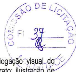
gráfico exclusivo para o município de Mauriti - CE; editoração de desenhos ilustrativos e catalogação visual do município de Mauriti - CE; direitos autorais de imagens e escritores locais estabelecido sem contrato; ilustração de diagramação do livro da cidade de Mauriti - CE com perspectivas do município; revisões ortográficas do livro do município de Mauriti - CE.