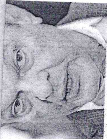
SARTO: mudanças seguidas na gestão