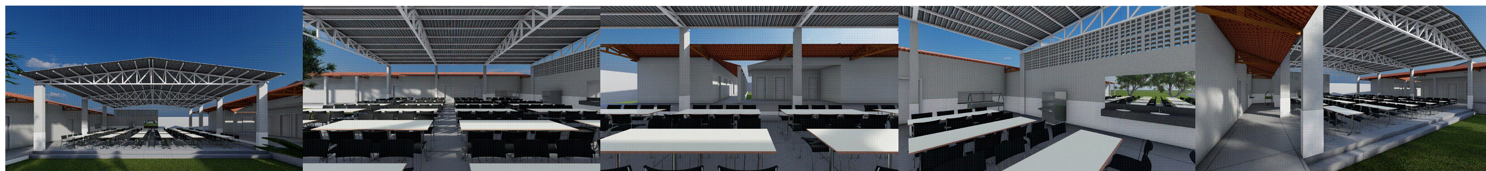
5 IMAGENS RENDERIZADAS SEM ESCALA