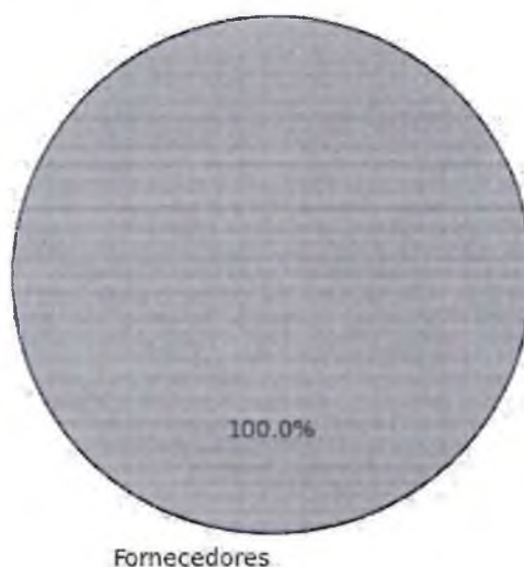
Distribuição dos Parâmetros Utilizados

A análise dos dados permite observar a importância de cada parâmetro na estimativa de preços, oferecendo maior confiabilidade ao processo.